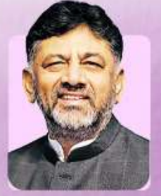
ಶ್ರೀ ಡಿ.ಕೆ. ಶಿವಕುಮಾರ್

ಕೌಶಲ್ಯಾಭಿವೃದ್ಧಿ, ಉದ್ಯಮಶೀಲತೆ ಮತ್ತು ಜೀವನೋಪಾಯ ಇಲಾಖೆ ಕೈಗಾರಿಕಾ ತರಬೇತಿ ಮತ್ತು ಉದ್ಯೋಗ ಅಯುಕ್ತಾಲಯ