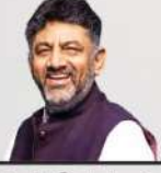
ಶ್ರೀ ಡಿ. ಕೆ. ಶಿವಕುಮಾರ್ ಮಾನ್ಯ ಉಪಮುಖ್ಯಮಂತ್ರಿಗಳು, ಕರ್ನಾಟಕ ಸರ್ಕಾರ