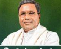
ಶ್ರೀ ಸಿದ್ದರಾಮಯ್ಯ ಸನ್ಮಾನ್ಯ ಮುಖ್ಯಮಂತ್ರಿಗಳು, ಕರ್ನಾಟಕ ಸರ್ಕಾರ