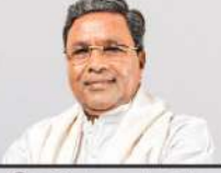
ಶ್ರೀ ಸಿದ್ದರಾಮಯ್ಯ ಸನ್ಮಾನ್ಯ ಮುಖ್ಯಮಂತ್ರಿಗಳು, ಕರ್ನಾಟಕ ಸರ್ಕಾರ