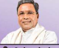
ಶ್ರೀ ಸಿದ್ದರಾಮಯ್ಯ ಸನ್ನಾಹ ಮುಖ್ಯಮಂತ್ರಿಗಳು, ಕರ್ನಾಟಕ ಸರ್ಕಾರ