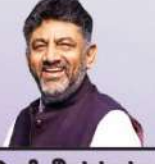
ಶ್ರೀ ಡಿ. ಕೆ. ಶಿವಕುಮಾರ್ ಮಾನ್ಯ ಉಪಮುಖ್ಯಮಂತ್ರಿಗಳು, ಕರ್ನಾಟಕ ಸರ್ಕಾರ