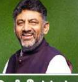
ಶ್ರೀ ಡಿ. ಕೆ. ಶಿವಕುಮಾರ್ ಮಾನ್ಯ ಉಪಮುಖ್ಯಮಂತ್ರಿಗಳು, ಕರ್ನಾಟಕ ಸರ್ಕಾರ